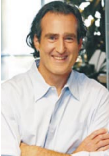
Office of Public Affairs &amp; Publications, U. Mass. Medical School