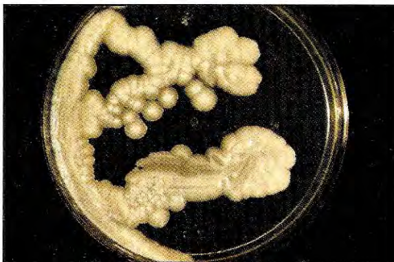
Figura 2a. Cultivo en agar glucosado de Sabouraud después de cuatro días de incubación a temperatura ambiente (28 °C).

La criptococosis fue descrita por primera vez en 1894 por Busse y Buschke, quienes observaron unos corpúsculos ovales o redondos en lesiones de la tibia de una mujer de 31 años. El agente etiológico resultante del cultivo fue denominado Saccharomyces hominis . Por la misma época, Sanfelice aisló una levadura encapsulada del jugo de duraznos, la cual, al ser inoculada en animales les ocasionó lesiones. En 1901, Vuillemin, al examinar los cultivos de Busse, Buschke y Sanfelice y no encontrar las ascosporas características del género Saccharomyces , transfirió estas levaduras al género Cryptococcus . En 1905, von Hansemann diagnosticó por primera vez la forma meníngea de la criptococosis.