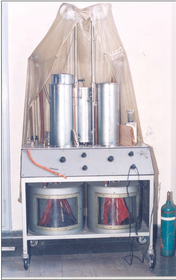
Figura 4. Broncoespirómetro, Warren E. Collins Inc.

destinado a los enfermos, en el octavo piso del edificio, "provisto de magníficos equipos y comodidades para los enfermos que tendrán en él ratos de alegre esparcimiento, y cuyas instalaciones sirven también como estación radiotransmisora para conferencias y programas especiales destinados a los enfermos reclusos en sus habitaciones" (2).