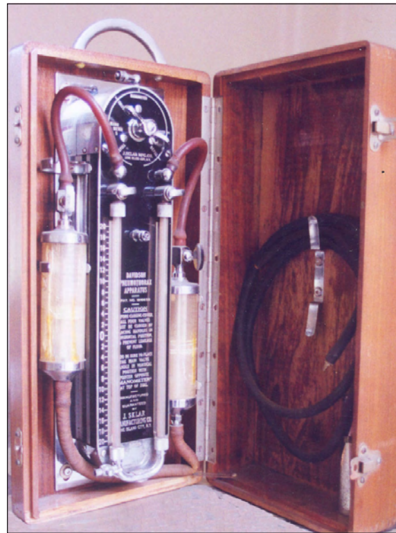
Figura 3. Aparato de neumotórax, Davidson 2.