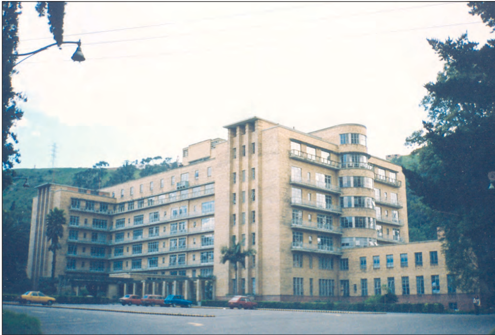
Figura 1. Fachada del edificio principal del Hospital San Carlos.