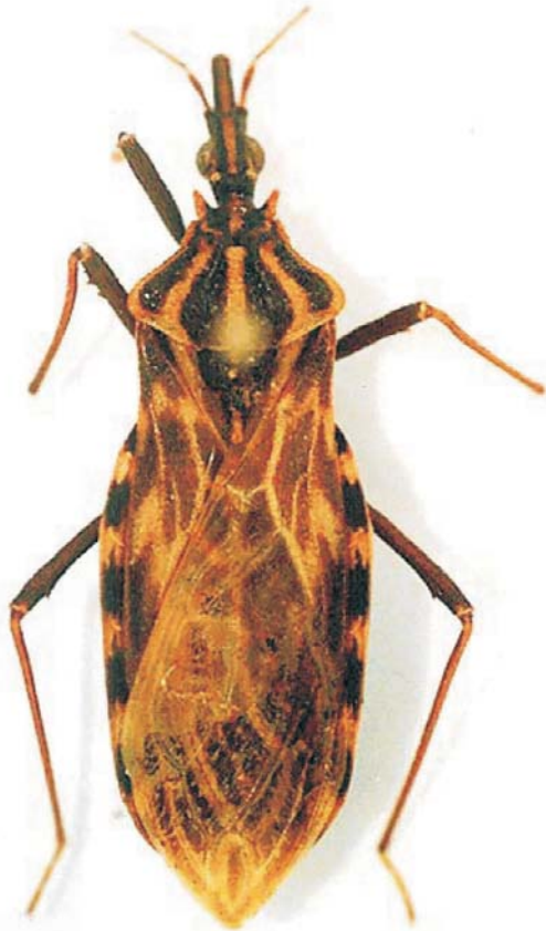
Figura 2. Triatoma nigromaculata (Stål, 1859), ejemplar encontrado en la vereda La Playa del municipio de El Tambo en Cauca, Colombia.

de P. rufotuberculatus , E. cuspidatus , E. mucronatus , R. pictipes , R. robustus , R. dalessandroi , R. neivai y R. brethesi .