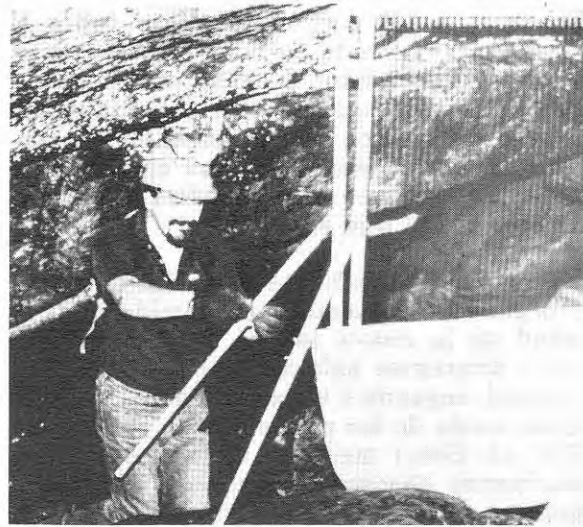
Fig. 2. Trampa de Tuttle (15) tal como fue colocada a la entrada de la Cueva del Edén para capturar los murciélagos.

3. Todos los murciélagos se clasificaron taxonómicamente por géneros y especies.