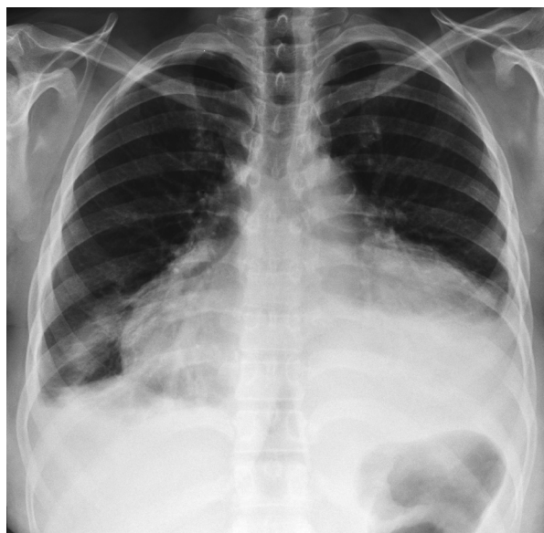
Figura 1. Radiografía antero-posterior de tórax en la que se observa cardiomegalia global, discreta elongación del cayado aórtico y derrame pleural bilateral con predominio izquierdo.

En la radiografía de tórax se observó cardiomegalia global con discreta elongación del cayado aórtico y derrame pleural libre, bilateral, de predominio izquierdo, que se desplazaba hacia el mediastino en la proyección en decúbito lateral derecho (figuras 1 y 2).