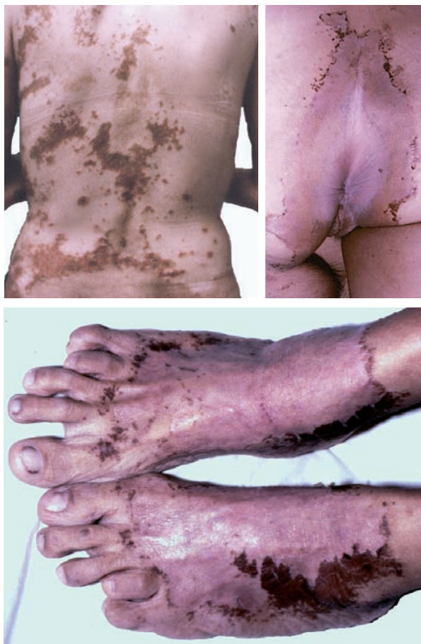
Figura 1. Placas eritematosas, descamativas e hiperpigmentadas

Las dermatosis paraneoplásicas son infrecuentes, de difícil diagnóstico (1) y se clasifican en enfermedades hiperqueratósicas, vasculares del tejido