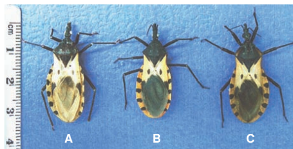
Figura 3. Variación cromática en especímenes de Triatoma dimidiata procedentes de diferentes regiones de Colombia. A. Huila. B. Boyacá. C. Sierra Nevada de Santa Marta.

Triatoma dimidiata presenta un comportamiento ecléctico, con un amplio espectro de huéspedes, los cuales incluyen desde especies silvestres y domésticas hasta el hombre. La sangre humana es la más comúnmente hallada en los insectos recolectados en el domicilio y peridomicilio (34). La especie ocupa ecótopos tanto naturales como artificiales, con éxito parcial o completo. Si las condiciones del refugio lo permiten, los perros y las gallinas son sus huéspedes más frecuentes, aunque un factor importante en la visita de los adultos silvestres a los domicilios humanos es la atracción hacia la luz artificial (58). El hallazgo de sangre de reservorios silvestres en el contenido estomacal de T. dimidiata , asociado con las altas tasas de infección natural, indicaría que participa de manera activa en el transporte de T.