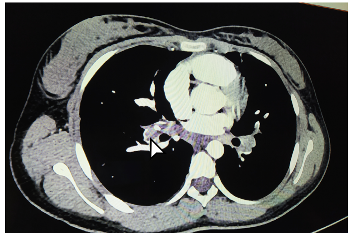
Figura 2. Tomografía computarizada de tórax. La flecha indica trombosis extensa de las venas pulmonares (derecha e izquierda).