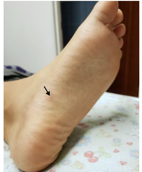
Figura 3. Lesión típica de tungiasis en estadio 5. Se observa una pápula circular difusa, desecada, con punto negro central cubierto de costra