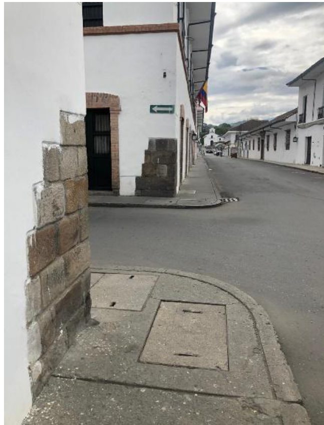
Figura 6. Piedras marfileñas en las esquinas de Popayán que servían a sus habitantes para rascarse y calmar el prurito producido por la tungiasis

La tungiasis influyó sobre la arquitectura y la cultura de esta ciudad colombiana conocida como la “Ciudad Blanca”. Todas las paredes de su centro histórico son blancas debido a que en la época en que las niguas abundaban se pintaron las fachadas con cal para erradicarlas. Además, eran frecuentes las piedras marfileñas incrustadas en las esquinas de las casas del centro de la ciudad, las cuales servían a sus habitantes para rascarse los pies (figura 6), tal como lo señala Horacio Dorado: “Era costumbre rascarse en las piedras de las calles” (7).