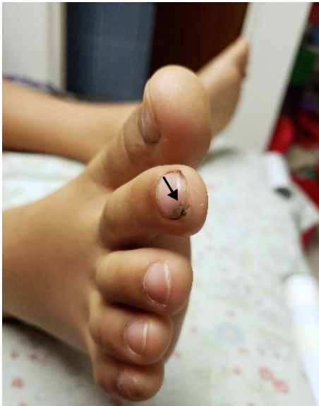
Figuras 1 y 2. Lesión típica de tungiasis en estadio 3a. Se observa una pápula translúcida con borde bien definido y circular, y en el centro, un área puntiforme color negro y halo hiperqueratósico.

Al mes de la consulta inicial, el paciente fue valorado en un control y se evidenció la resolución total del cuadro, descartándose la presencia de nuevas lesiones. Se obtuvo el consentimiento informado por escrito de la madre del paciente para la publicación de este informe del caso y de las imágenes.